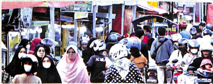
PASA Pabukoan beroperasi di Kota Padangpanjang yang terletak di beberapa kelurahan.

"Pemko berharap kegiatan Pasa Pabukoan yang tersebar di berbagai kelurahan akan membantu pemulihan ekonomi pasca pandemi. Masyarakat juga diharapkan membeli pabukoan tersebut agar uang berputar di kota kita," harapnya. (red)