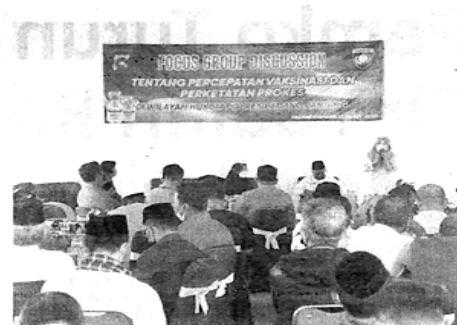
FGD - Polres menggelar Focus Grup Discussion (FGD), Jumat (1/4) lalu di Gedung Wicaksana Laghawa menyikapi rendahnya vaksinasi anak di kota itu. (152)

Novianto mengucapkan terima kasih kepada seluruh lapisan masyarakat yang telah mendukung program vaksinasi yang sudah berjalan selama ini. Secara umum, capaian vaksinasi sudah tinggi, hanya vaksinasi bagi anak yang masih rendah. (205)