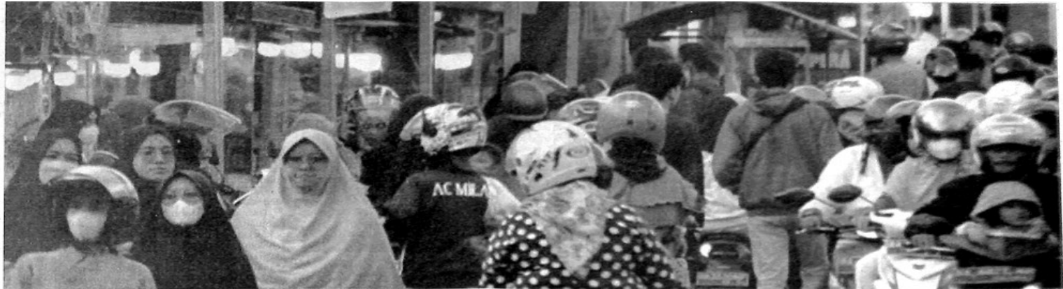
PENGUNJUNG membludak di Pasar Kuliner Padangpanjang yang menjadi salah satu pusat Pasar Pabukoan di Kota Padangpanjang.