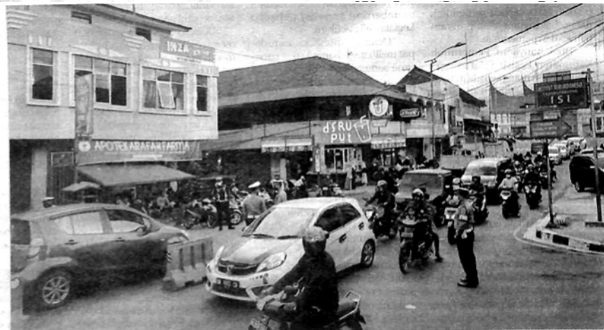
PETUGAS melakukan pengaturan lalu lintas di kawasan Pasar Kuliner dan depan Gedung M Syafei Padangpanjang.

"Kita mengimbau kepada semua masyarakat pengguna jalan, agar selalu berhati-hati dalam berkendara. Utamakan keselamatan, ingat keluarga kita menanti di rumah," tutupnya. (ned)